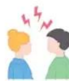
Рост конфликтных ситуаций со сверстниками в школе