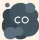
Отравление угарным газом