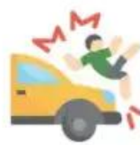
Дорожно – транспортные происшествия